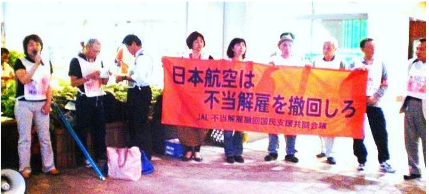
写真: 上は大阪伊丹空港で支援者と共にマイクを握り訴える原告。右下: 伊丹空港でビラを配る支援者たち

5月29日は都内6ヵ所(立川、新宿、池袋、有楽町、錦糸町、品川)の駅頭で、大阪伊丹空港は5月24日、福岡では5月30日に3ヵ所(福岡空港、博多、小倉)で、地裁の不当決後初めての全国一斉宣伝行動が行われました。伊丹空港では45人全員がこの日のために作成したゼッケンを付けて、1,000枚のビラを配りました。原告は参加者との連帯、そしてビラを受け取った方からの激励の言葉に大いに励まされ、闘いの力を益々大きくしました。