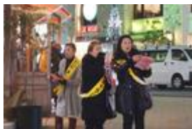
原告の友人も差し入れを持って参加