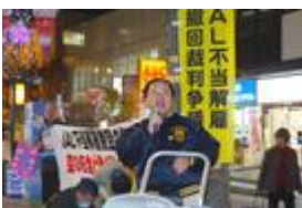
力強い連帯の挨拶