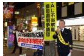
模擬制服での訴えは注目度抜群