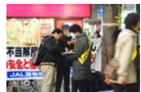
署名も31筆集まりました