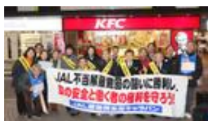
参加者13名で記念撮影