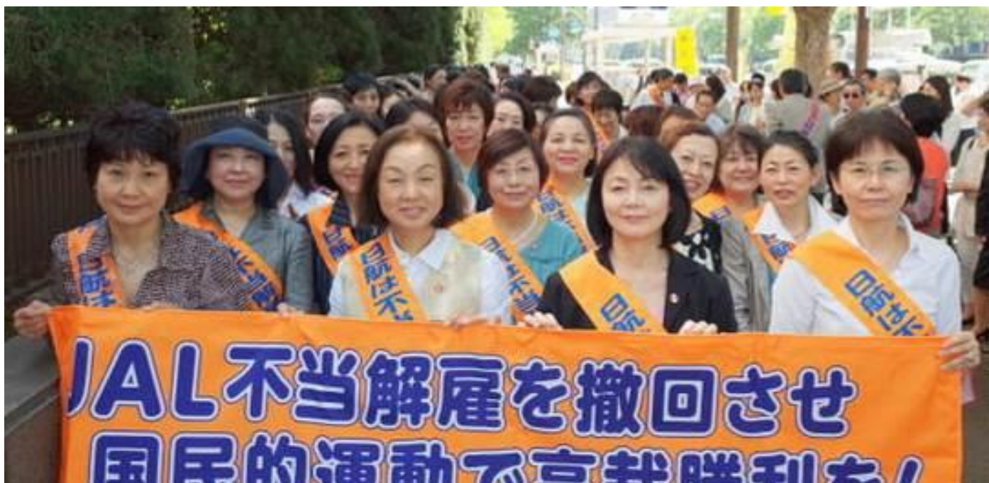
【写真】 整列し入廷する客室乗務員原告団の皆さん

5月31日、客室乗務員裁判の第3回口頭弁論が東京高裁 101号法廷で行われました。裁判への関心は高く、裁判所前での宣伝行動に235名が参加し裁判の行方を見守りました。今回は裁判官が1名交代したため、弁論更新にあたり上条弁護士が意見陳述を行いました。また、5名申請した証人の内、4名が採用され、証人尋問は9月12日に決定しました。